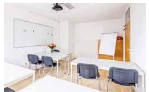
Unser Raum Albert