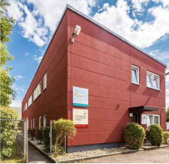
Hier finden Sie die Heilpraktikerschule Landsberg