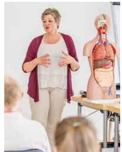
Unterricht mit Herz und Verstand.