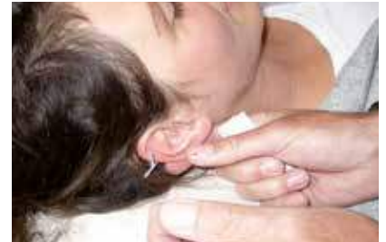
Praktischer Unterricht und Üben: mit Akkupunkturnadeln

In der Naturheilkunde und auch bei dem Beruf des Heilpraktikers kann jeder seinen ganz persönlichen Begabungen und Neigungen entsprechend aus der Vielzahl der Verfahren genau das Passende für sich und seine Patienten auswählen. Damit ist und bleibt dieser Beruf vielfältig und lebendig.