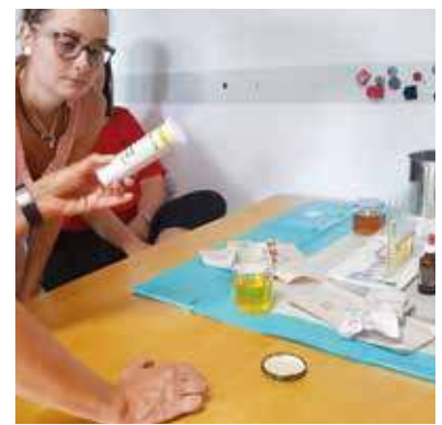
Praktischer Unterricht – sofort in eigener Praxis umsetzbar