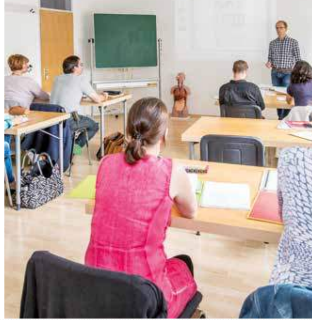
Unser großer Unterrichtsraum in Landsberg