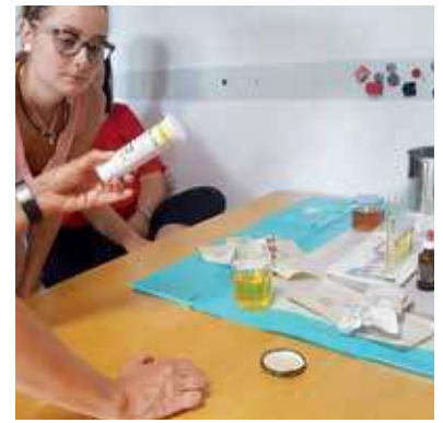
Praktischer Unterricht – sofort in eigener Praxis umsetzbar