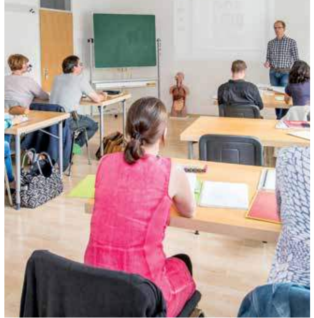
Unser großer Unterrichtsraum in Landsberg