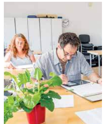
Umfassendes Wissen - anschaulich und interessant vermittelt