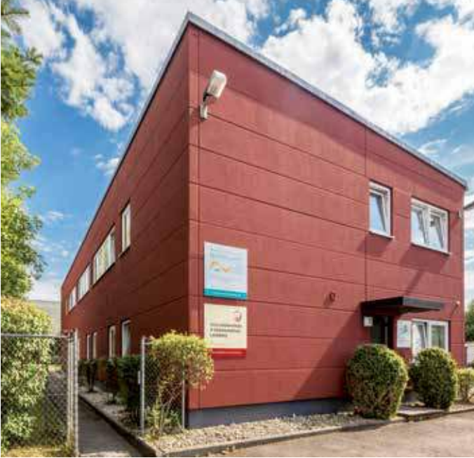
Hier finden Sie die Heilpraktikerschule Landsberg