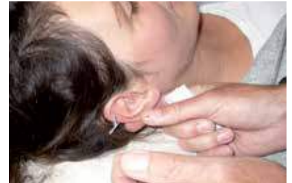
Praktischer Unterricht und Üben: mit Akkupunkturnadeln

In der Naturheilkunde und auch bei dem Beruf des Heilpraktikers kann jeder seinen ganz persönlichen Begabungen und Neigungen entsprechend aus der Vielzahl der Verfahren genau das Passende für sich und seine Patienten auswählen. Damit ist und bleibt dieser Beruf vielfältig und lebendig.