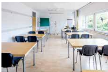
Unser großer Unterrichtsraum