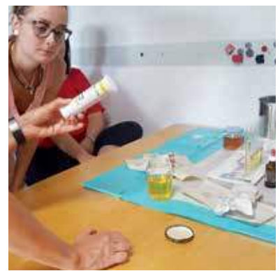
Praktischer Unterricht – sofort in eigener Praxis umsetzbar