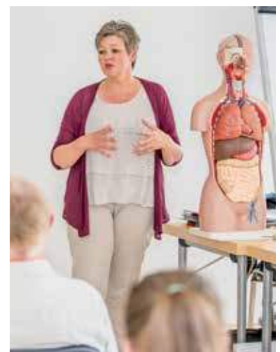
Unterricht mit Herz und Verstand.