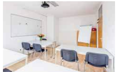
Unser Raum Albert